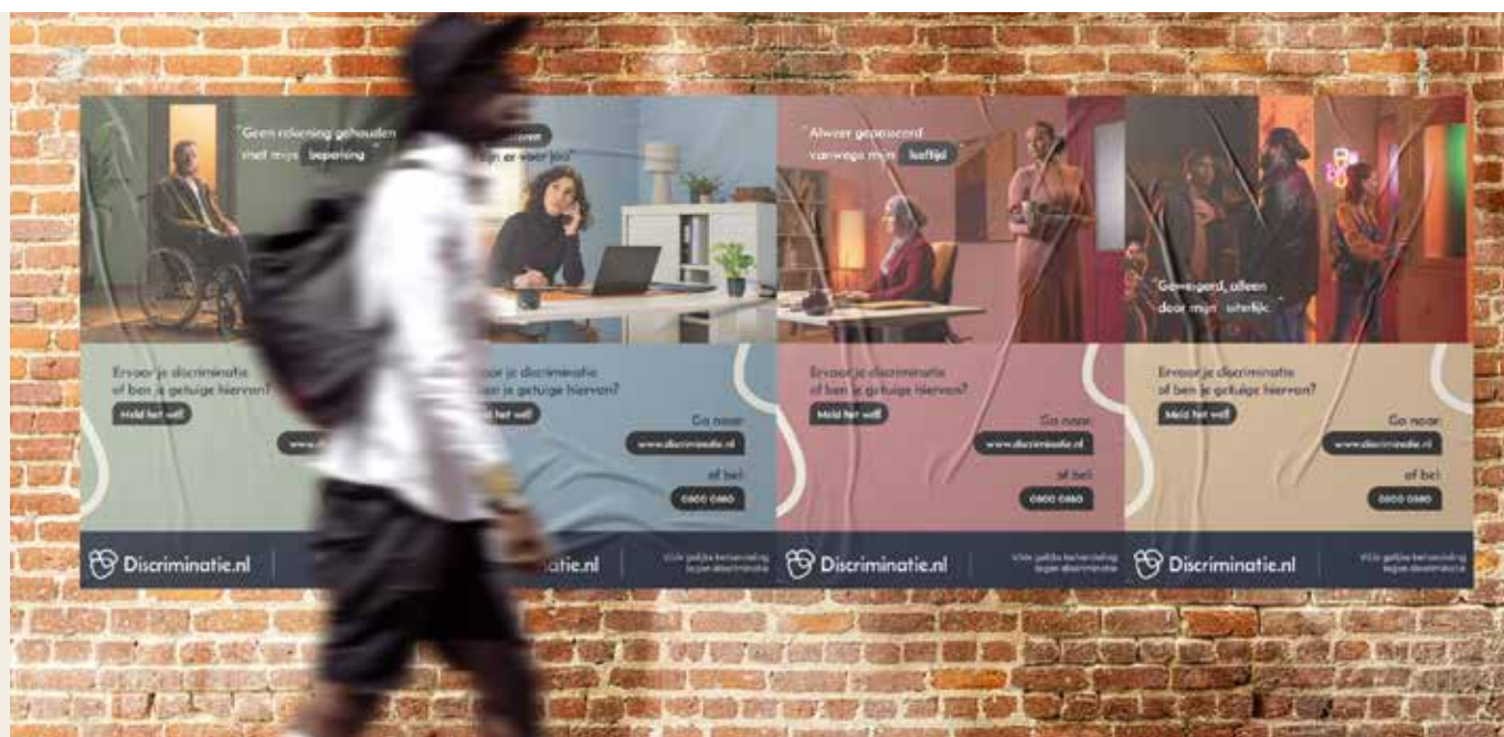
Postercampagne DRA 2025

Voor een optimale uitvoering van onze rol in de samenleving is het belangrijk dat interne processen en procedures vastgelegd en meetbaar zijn. Dit begeleidingsproces wordt elk jaar verder aangescherpt. Dankzij dit proces is ook beter zicht verkregen op actuele trends en is inzichtelijk welke kennishiaten er zijn binnen de organisatie. Door middel van deze inzichten kunnen we ons continu blijven ontwikkelen om alle melders blijvend te kunnen voorzien van kwalitatieve dienstverlening.