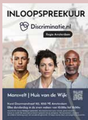
Inloopspreekuur Huis van de Wijk, Amsterdam West