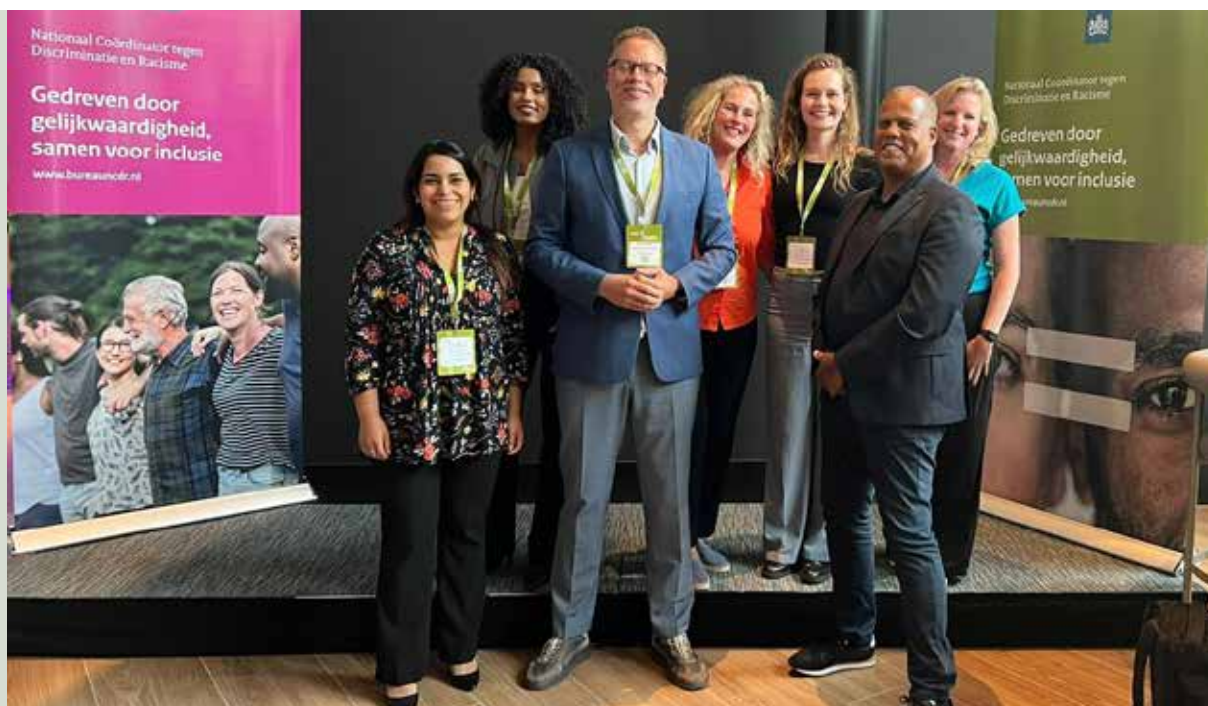
Nationaal Congres NCDR

DRA nam deel aan een bijeenkomst van de Vrouwenrechtswinkel over ouders, kinderen en recht.