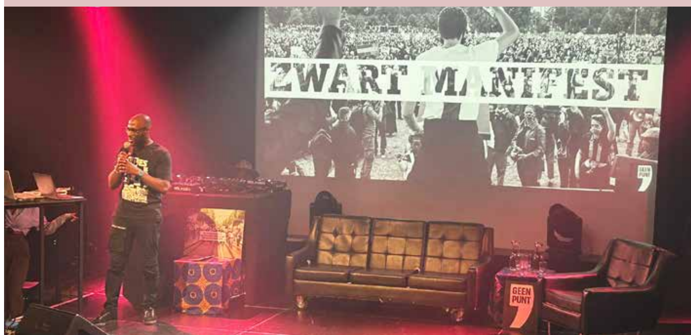
5 jaar Black Lives Matter en 4 jaar Zwart Manifest bijeenkomst