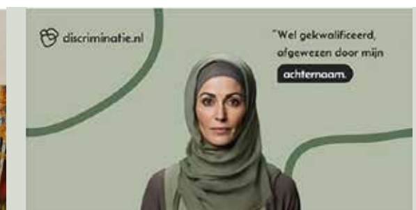
Digitale zichtbaarheid: social media posts