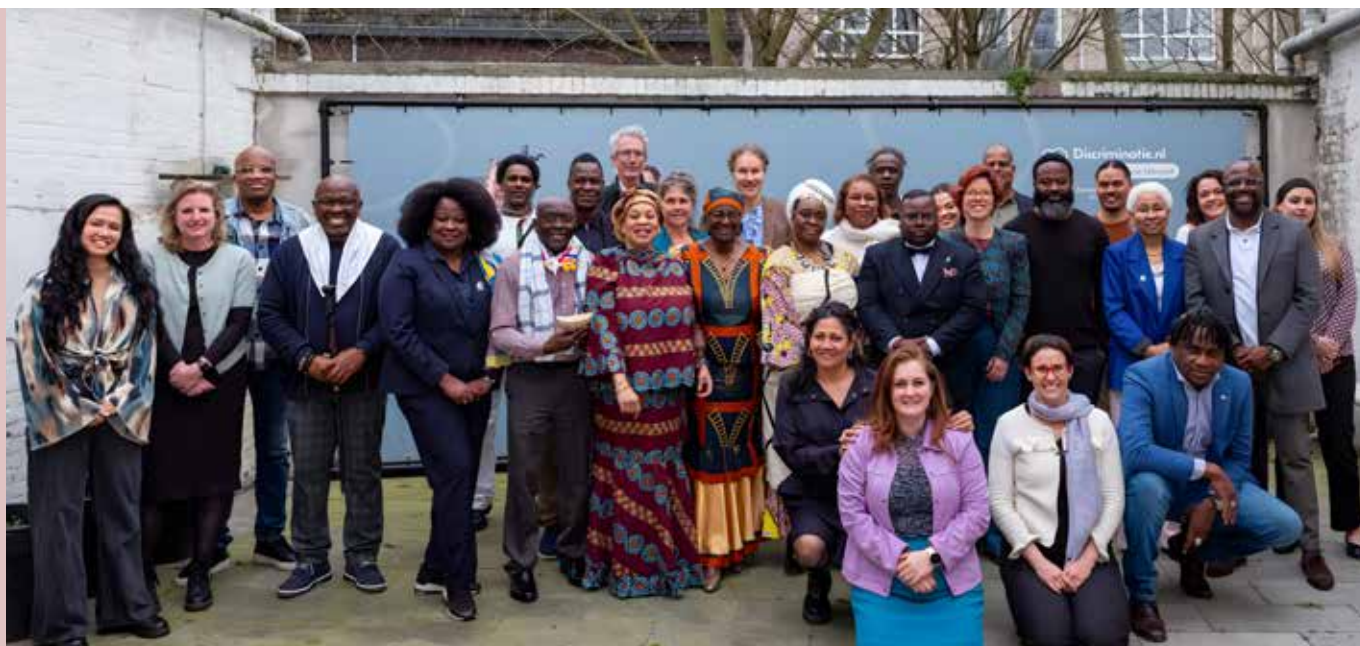
Netwerkbijeenkomst: Symposium 'De Overheid aan zet – oproep tot de lancering van het tweede VN Decennium voor personen van Afrikaanse Herkomst'

In het kader van landelijke samenwerking en positionering heeft DRA deelgenomen aan de evaluatie van de pilot rondom het tegengaan van de verkoop van antisemitische boeken bij de Nationaal Coördinator Antisemitismebestrijding (NCAB). Tijdens deze bijeenkomst hebben wij ons werk gepresenteerd en onze ervaringen gedeeld. Hiermee dragen wij bij aan de landelijke dialoog en versterken wij onze zichtbaarheid en rol als inhoudelijke partner.