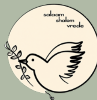
Bijeenkomst 'Deel de Duif'