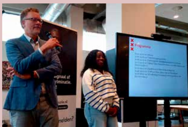
Opening inloopspreekuur Amsterdam Nieuw-West

DRA was aanwezig bij het evenement van samenwerkingspartner RITA (Friedraiser) ter ondersteuning