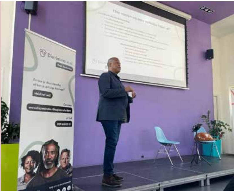
Bijeenkomst samenwerking Team Goed Verhuurderschap gemeente Amsterdam