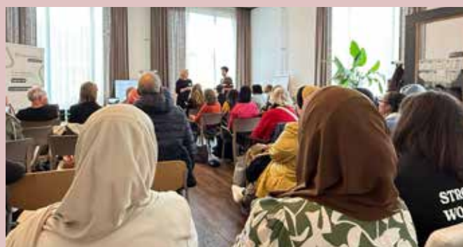
DRA wordt geïnterviewd tijdens de Week tegen Racisme Bijeenkomst Vrouwenrechtswinkel