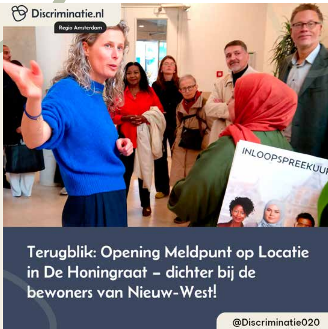
Meldpunt en Inloopspreekuur in Buurtcentrum de Honingraat