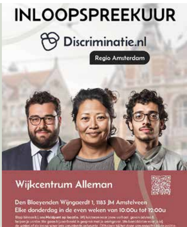
Inlooppreekuur Alleman Amstelveen

Ook is ingezet op het versterken van de lokale samenwerking met inwoners en partners in de gemeente Amstelveen. In dit kader zijn bestaande contacten geïnventariseerd en wordt actief gewerkt aan het verder uitbouwen van relaties.