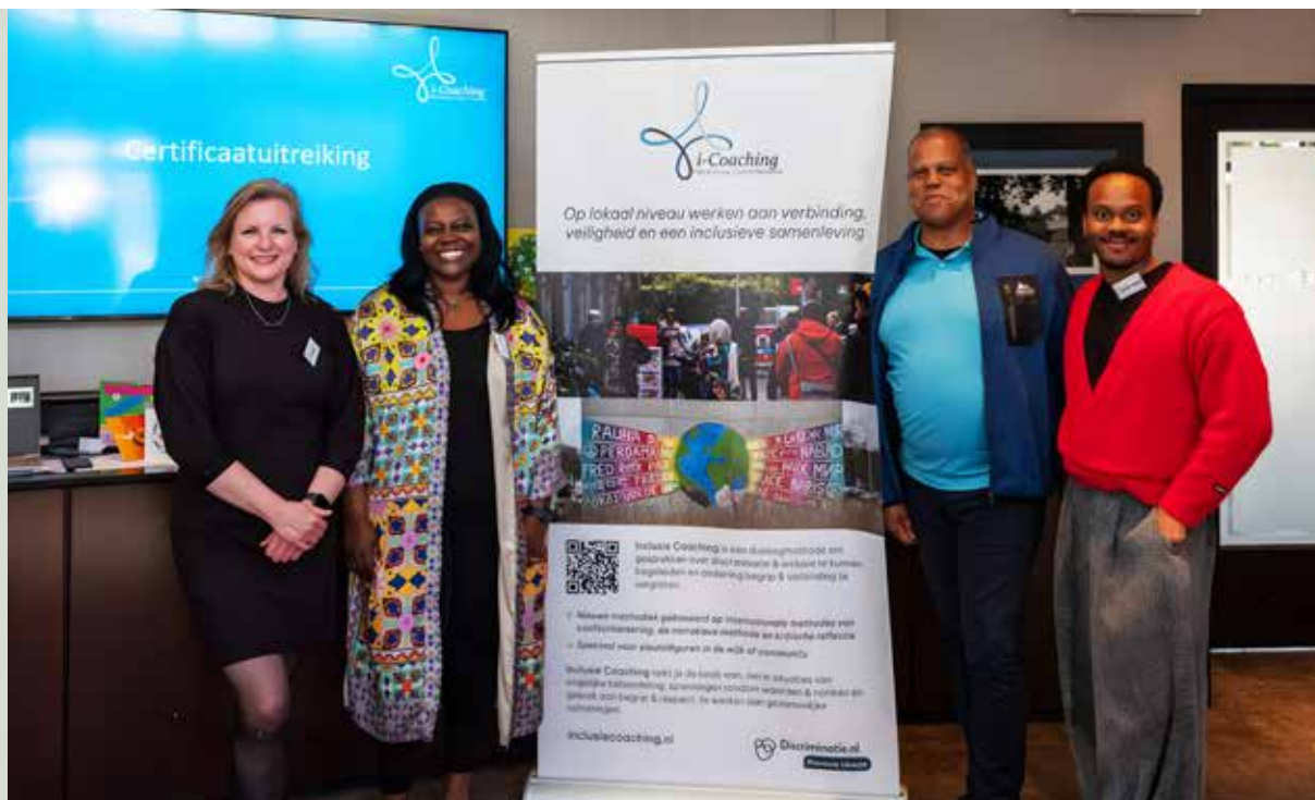
Opleiding Inclusie Coach