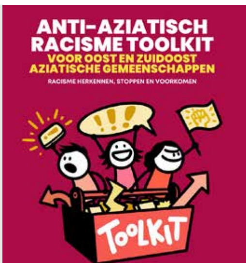
Toolkit Anti-Aziatisch racisme