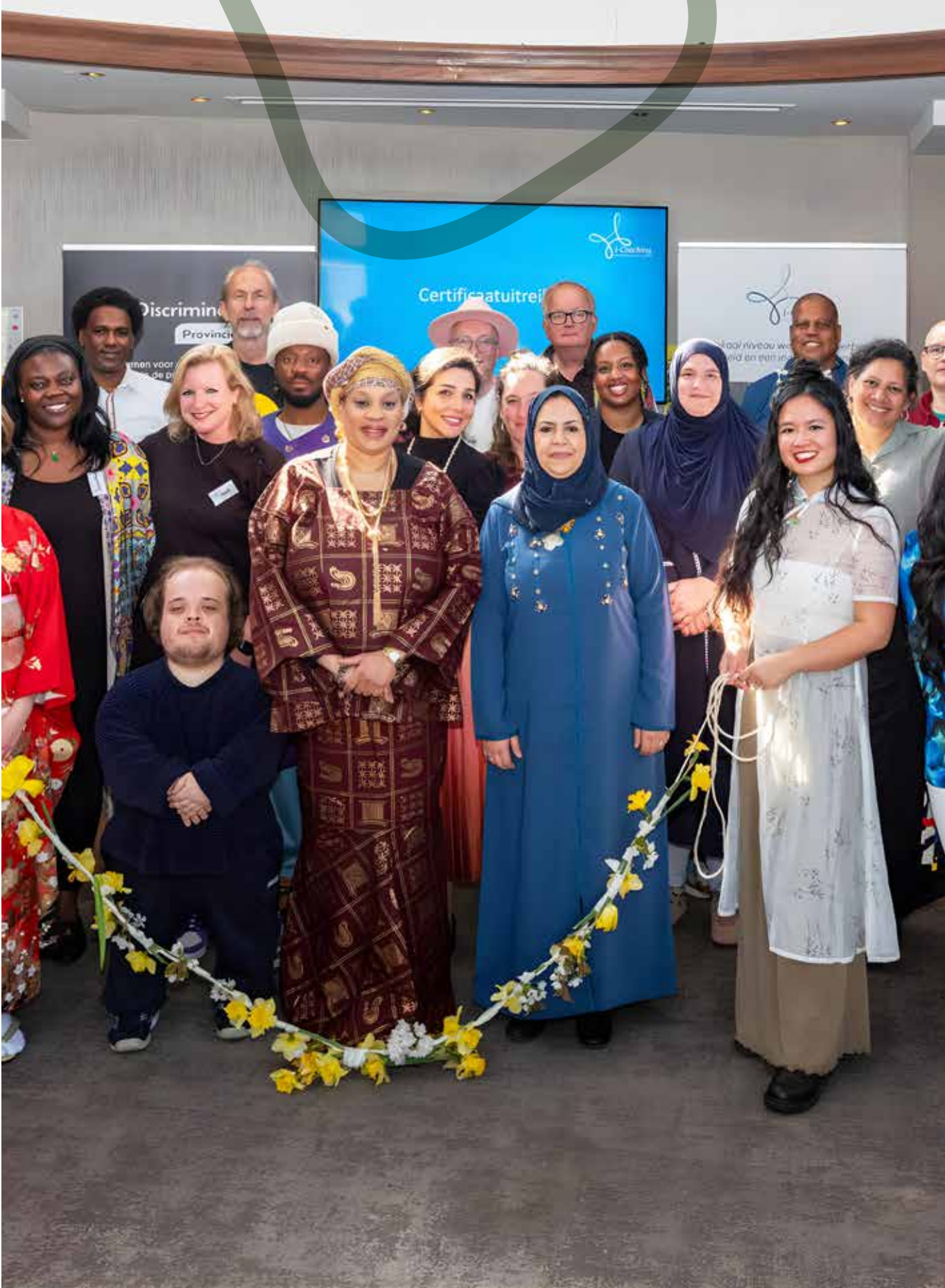
Opleiding Inclusie Coach