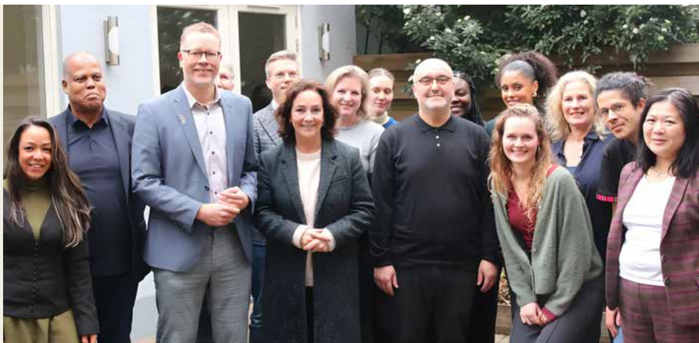
Werkbezoek burgemeester Halsema aan kantoor DRA, groepsfoto met team DRA

Het team omvat acht consultants, een beleidsmedewerker, een projectcoördinator, een officemanager, een coördinator klachtbehandeling, een extern communicatiebureau en een directeur.