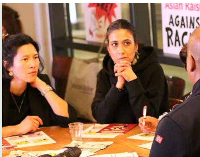
Week tegen racisme: presentatie Toolkit