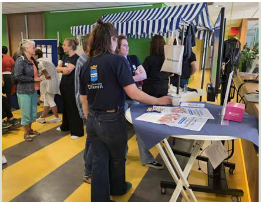
Inloopspreekuur De Brede HOED Diemen DRA is aanwezig op event Diemer Festijn