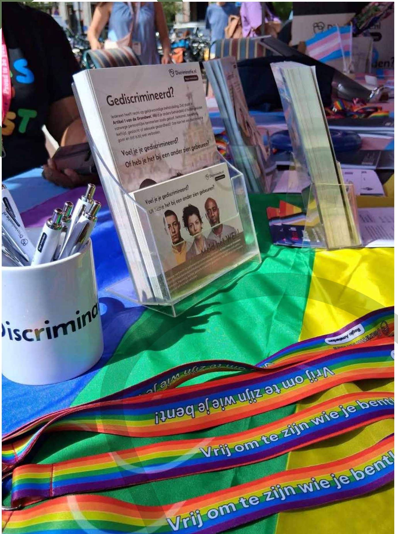
Divers promotiemateriaal van DRA tijdens de markt op Pride Oost.