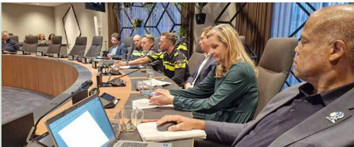
Expert meeting Antisemitisme & Discriminatie Gemeente Amsterdam