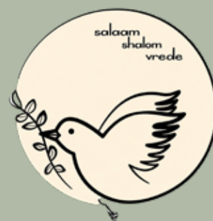
Bijeenkomst 'Deel de Duif'