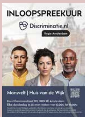
Inloopspreekuur Huis van de Wijk, Amsterdam West