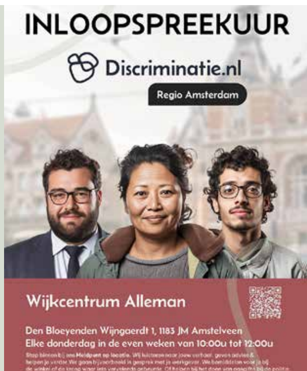
Inlooppreekuur Alleman Amstelveen

Ook is ingezet op het versterken van de lokale samenwerking met inwoners en partners in de gemeente Amstelveen. In dit kader zijn bestaande contacten geïnventariseerd en wordt actief gewerkt aan het verder uitbouwen van relaties.